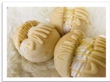
ホワイトホイップ 120円(税込)