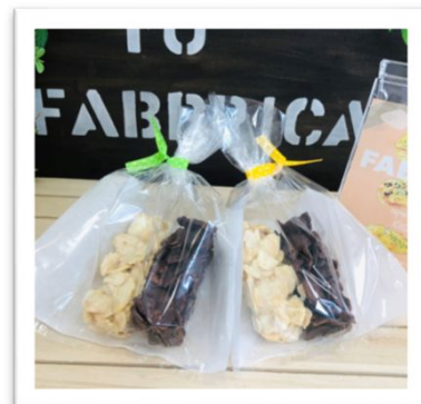
チョコレートバー 150円(税込)