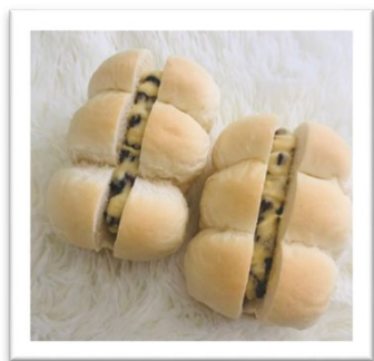
ミニフレッド 200円(税込)